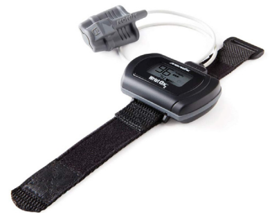
Oxymètre de pouls Nonin Wrist Ox2 3150 pour intégration SpO2