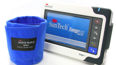
Le tensiomètre Suntech Tango permet d'intégrer plusieurs paramètres, dont la SpO2

Plusieurs formats de rapport d'impression (une voie, toutes les voies, intégral, résumé, tendances, QRS, etc.)